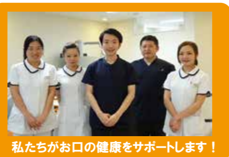
私たちがお口の健康をサポートします！