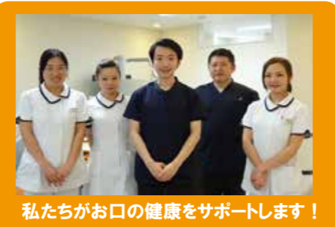
私たちがお口の健康をサポートします！

基本的に保険内診療となりますので、ご安心ください。 ※初診時と毎月初めには保険証などを確認させていただきます。