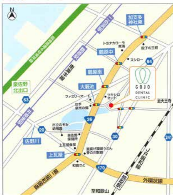
第二阪和国道(国道26号線)「上瓦屋」交差点を北東に650m直進、「大藪池」交差点を東へすぐ