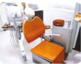
※無料駐車場がございます