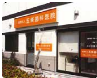
■アクセス 第二阪和国道(国道26号線)「上瓦屋」交差点を北東に650m直進、「大藪池」交差点を東へすぐ